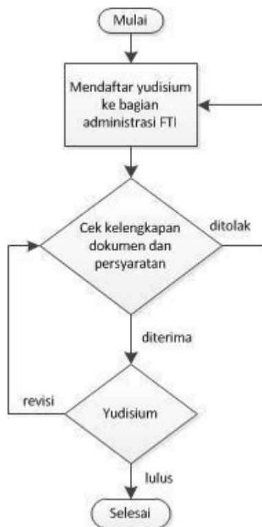
Gambar 3 Prosedur Yudisium

Adapun penjelasan dari gambar 3 adalah sebagai berikut.